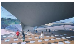
Auditorio del Campus

Facilita el aprendizaje del contenido del curso, y permite la interrelación con otros alumnos, así como el contacto on line con su tutor, participación en los foros de debate, acceso al contenido de la biblioteca, y muchas más posibilidades.